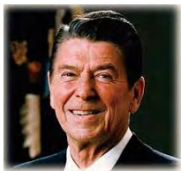
ロナルド・レーガン第40代アメリカ合衆国大統領