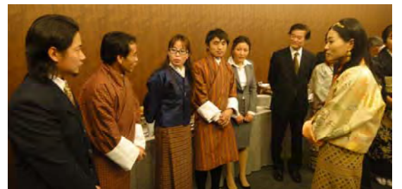
ブータン留学生たちと親しくお話をする王女殿下