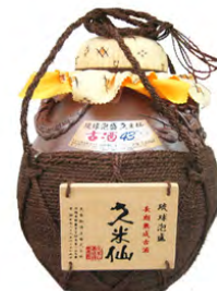
お祝いに人気の琉球泡盛3升壺

久米仙酒造は「一歩進んだ泡盛づくり」をモットーに業界に新風を送り続けてきました。こだわりの泡盛を皆さまへご提供いたします。