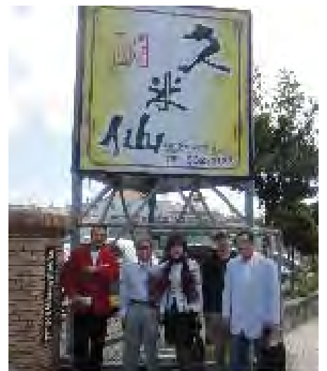
那覇市の久米仙酒造を訪問

『本会は、日本とASEAN諸国との相互の文化的理解を基盤として、経済的社会的発展と国民相互の友好協力に貢献することを目的とする』