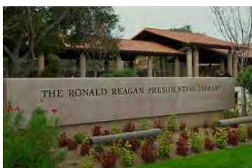
レーガン・ライブラリー