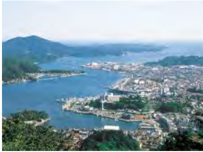
震災前の美しい気仙沼港

3月11日東日本大震災により、被災された全ての皆様、被災地域の関係者の皆様に対し、心よりお見舞い申し上げます。 被災された地域の日も早い復興を心より祈念申し上げますとともこれからも日本経営者同友会は全力を尽くして応援してまいります。