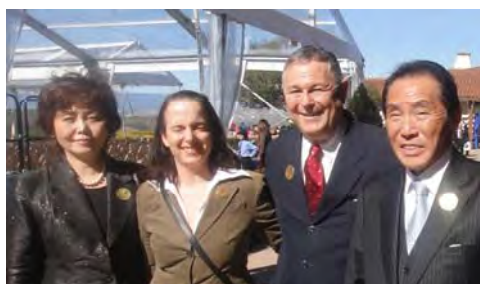
生誕祭会場に参加者の方々と一緒に