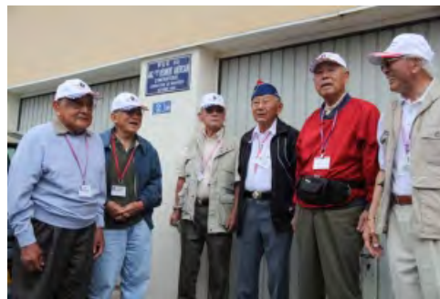
「442」制作に関わった方々