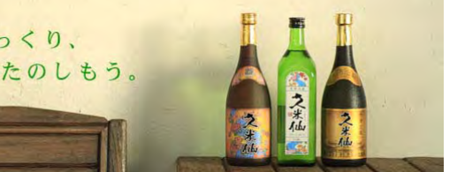
ゆっくり、たのしもう。

久米仙酒造は「一歩進んだ泡盛づくり」をモットーに業界に新風を送り続けてきました。こだわりの泡盛を皆さまへご提供いたします。