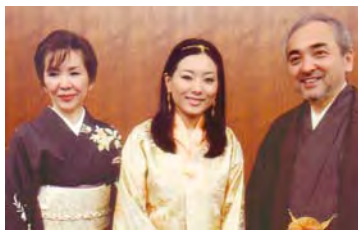
JEPA会友・池上ご夫妻と一緒に