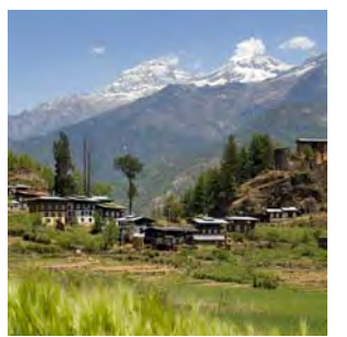
美しいブータンの里山

2月12日～13日、国立京都国際会館において、地球環境保全に貢献した人として、ブータンのワンチュク前国王が「KYOTO地球環境の殿堂」より受賞されました。授賞式にはケサン・チョデン・ワンチュク王女殿下が出席、前国王のメッセージを代読されました。ここにメッセージの全文を掲載いたします。(日本経済新聞より)