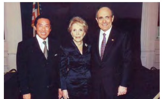
ナンシー夫人、ジュリアーノ前NY市長とともに

下地会長はレーガン・ライブラリー設立時からの支援者として、またライブラリーの国際委員会のメンバーとして現在も絆は強い。