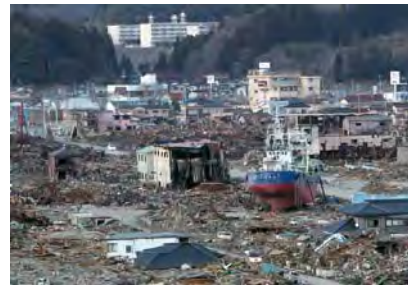
津波で破壊された気仙沼港

3月11日東北地方を襲った超弩級の地震と大津波による被害を境に日本経済は暗転した。 その日、東北地方を襲った国内観測史上最大規模の地震と巨大津波は岩手や宮城、福島など11都県の太平洋沿岸地域に壊滅的な被害をもたらした。