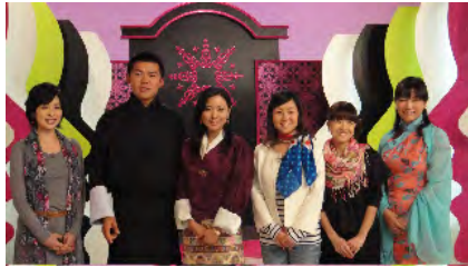
NHKをご訪問なされた王女殿下ご夫妻。NHK職員の方々と一緒に。ご夫妻は大河ドラマ「江～姫たちの戦国～」のセットもご訪問、興味深くご覧になられた。