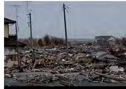
津波で破壊された釜石

人々の穏やかな日常が魔法のように跡形もなく消え去ったのだ。更に地震と津波は福島第一原子力発電所事故を誘発し、「放射能」という災厄と恐怖を日本のみならず世界に解き放ってしまった。また、東北地方には世界中の大手メーカーにとって必要不可欠な部品を