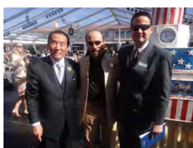
生誕祭の会場で米国の知人とともに