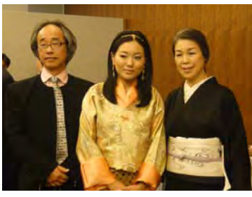
JEPA会友・長艸ご夫妻と一緒に