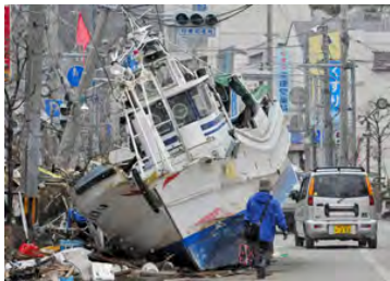
街まで流された船

日本経営者同友会は資源の宝庫ともいえるアジア及び米国に強力なパイプを持つている。そのパイプを苦闘する中小企業経営者、そして被災地復興のために役立てるよう全力を尽くしたい。