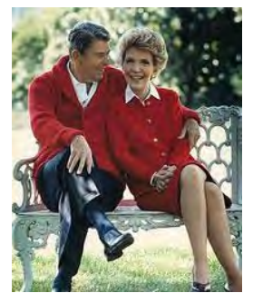
在りし日の大統領ナンシー夫人

1980年の大統領選で現職のカーター大統領を破って当選した当時69歳のレーガン大統領は、米国で最年長で選出された大統領でもあった。1984年民主党候補のモンデル候補に空前の地すべりの大勝を果たし、1989年まで2期8年の任期を満了した。