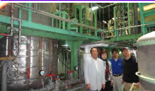
久米仙酒造工場を訪問