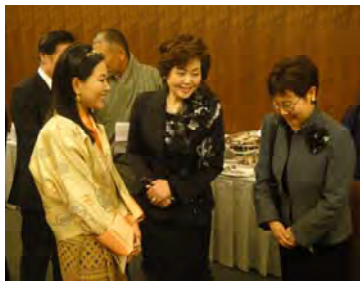
JEPA会友・中野教授とご歓談

1884年に設立され、近代日本の歩みと共に歴史を重ねてきた東京倶楽部は設立127年を迎える。歴代の名誉総裁に宮殿下を戴き、現在の名誉総裁は常陸宮正新王殿下。