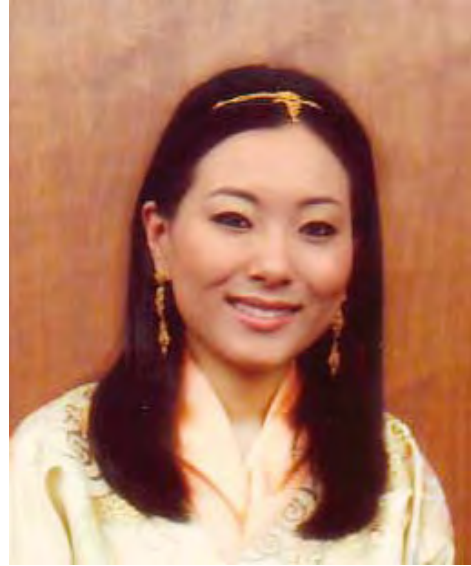
ケサン・チョデン・ワンチュク王女殿下

「GNHで国民の97%が幸福だと考えている。 ブータン方式に関心を寄せる先進国」