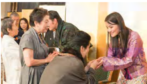
出席者のお一人お一人と握手する国王陛下とジツェン王妃