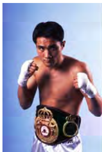
竹原慎二元世界ミドル級チャンピオン

財団法人スポーツ会館は、スポーツ会館として日本で初めて財団法人として認定された歴史のあるスポーツ会館として、これまで多くのアスリートや芸能人を輩出しています。