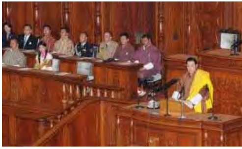
国会で演説なさるブータン国王

若き国王と美しい王妃は、華やかな民族衣装と温かな笑顔で、これまで日本を訪問した海外のどの国賓よりも日本国民の注目を集めました。