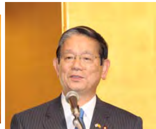
ご挨拶する町村友好議員連盟

『本会は、日本とASEAN諸国との相互の文化的理解を基盤として、経済的社会的発展と国民相互の友好協力に貢献することを目的とする』