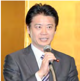
ご挨拶する玄業外務大臣