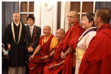
ブータンと日本の僧侶の方々