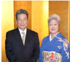
日本・ブータン友好協会 榎会長ご夫妻