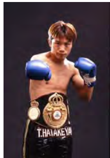
畑山隆則元世界ライト級チャンピオン