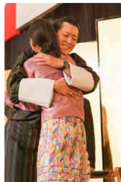
Noble embrace (高貴なる抱擁)