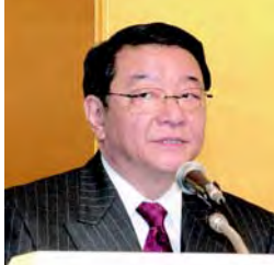
ご挨拶する藤村官房長官