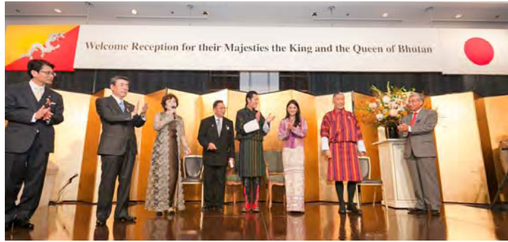
壇上で国王同王妃両陛下をお迎えする主催者の方々