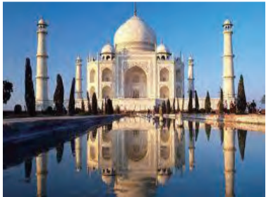
世界遺産タージマハール

将来の世界経済を牽引するとされる国はブラジル、ロシア、インド、中国、南アフリカの五カ国で、一般的にBRICSと総称されている。その中でインドは2020年頃に一度は中国に国内総生産高（GDP）で首位の座を譲るものの、2050年にはインド国内の購買力平価（PPP）ベースでGDPを85.97兆ドルまで押し上げ、2位の中国（80.02兆ドル）、3位の米国（30.07兆ドル）を引き離し、世界のトップになると予想される。日本は6.48兆ドルで9位に後退すると予想される。