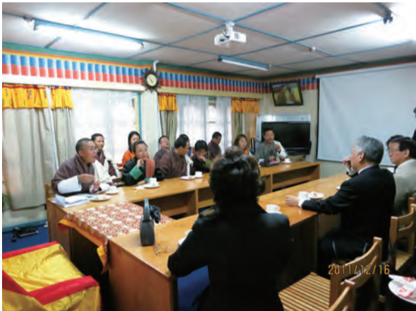
日本からの寄付をブータン政府教育省にお届けしました