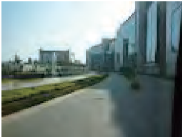
インドのシリコンバレーと呼ばれるバンガロール