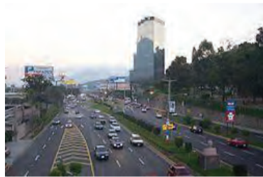
首都サンサルバドル市

エルサルバドル共和国は中南米に位置し、九州の約半分ほどの国土におよそ620万人の人が住んでいます。1992年に内戦は終了、2度の大地震やハリケーン等の自然災害に見舞われながらも経済はプラス成長を維持。2009年に就任したフネス大統領のもと積極外交を推進、日本に対してもビジネス交流を強く希望しています。セラヤンディア大使がJEPAを訪問された際にも、JEPA会員企業とエルサルバドル相互のビジネス交流のチャンスについて意見が交わされました。