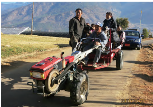
日本から寄贈された農業用トラクター