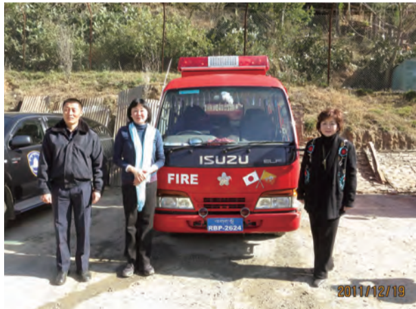
昨年9月に寄贈された消防自動車の前で