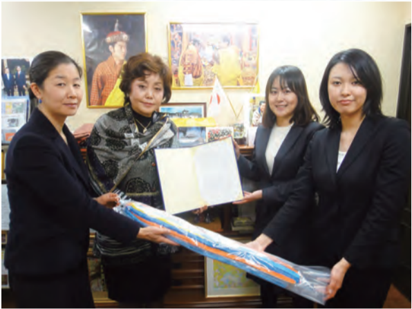
徳田名誉総領事に千羽鶴を贈る学習院女子大学のお2人