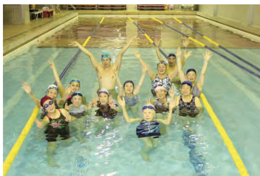
皆で楽しく元気にスイミング