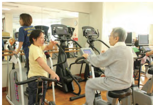
自分に合ったスポーツを楽しむ会員の方々