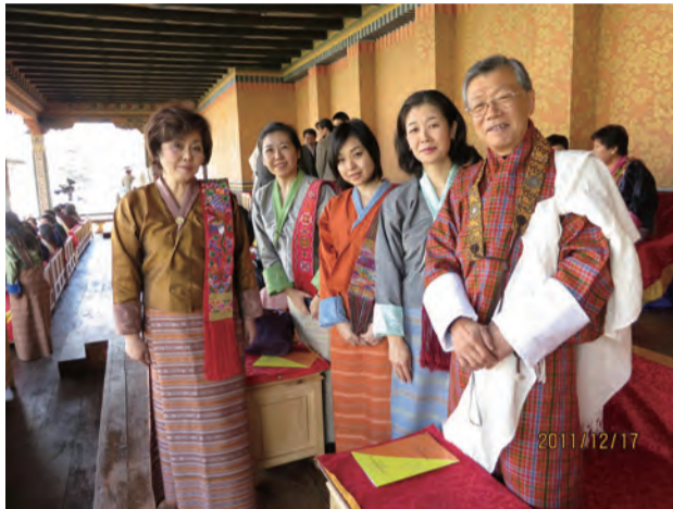
建国記念日の式典にブータンの民族衣装を着て参列

とりわけ印象深かったのは、国王御夫妻とツアー・メンバーがお会い出来たことでした。国王陛下は公務でお忙しく、また他国の賓客も訪問中の中、時間をとって和やかで爽やかな時間を共に過ごして下さいました。昨年の来日時と違わぬお二人の誠実で思いやり溢れる様子が皆感激もひとしおでした。