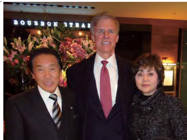
ライアン氏(中央)と共に

今回の米国出張で、下地会長と徳田代表はワシントンDCで長年の友人F・ライアン氏と会談しました。会談では、ライアン氏の大統領選や米国の現状について意見が交わされました。ライアン氏は、現在米国の政治に就いては、現在も様々な要職に就いており、米国の政治についてオンラインで発信する「POLITICO」の社長でもあります。