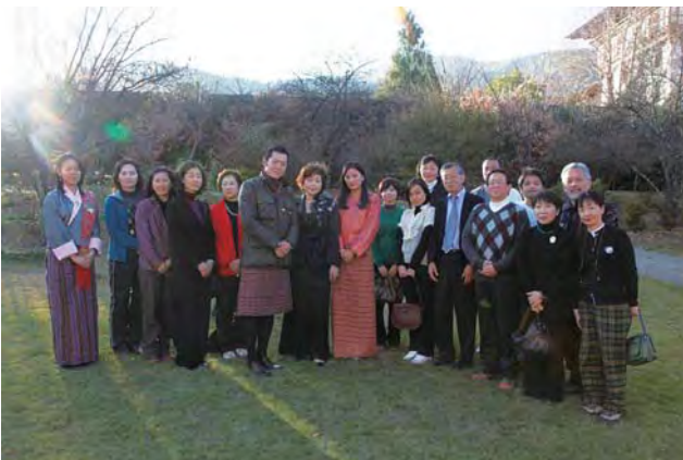
王宮のお庭で国王ご夫妻と共に

ブータンに着いて4日目、国王ご夫妻がツアー一行とお会いくださいました。ご多忙な公務の中、昨年の来日時と変わらぬ誠実で爽やかな笑顔のご夫妻に一行も感激ひとしおでした。(2面に続く)