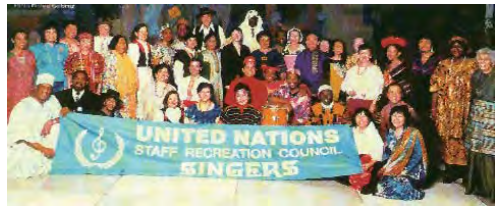
様々な国籍の国連合唱団員

サンフランシスコはロサンゼルスに並ぶ経済、工業の中心地として知られており、産業集積、気候、そして日本への距離の近さにより物流拠点としても魅力がある。現在約550社の日系企業(主としてサービス業、IT関連企業など)が存在し、そのうち約半数の日系企業はここ数年間の不況の最悪期を脱して回復に向かうと期待している。観光地としての評価も非常に高く、有名な観光スポットとしてゴールデンゲートブリッジ(金門橋)や市内を走るケーブルカーも人気が高い。日本企業の進出先として今後も人気は高く商的に有望な都市といえる。