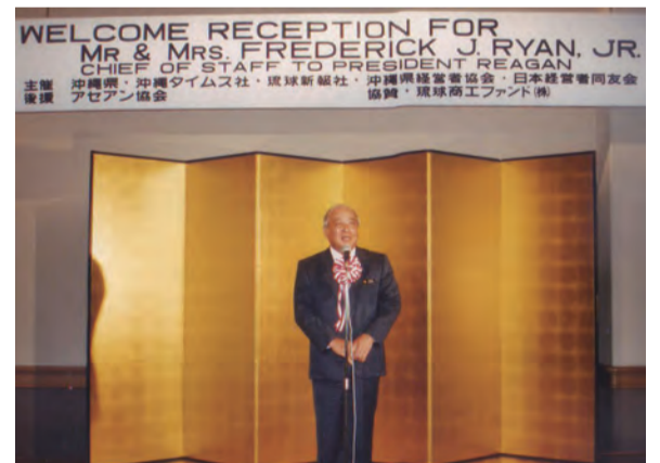
歓迎会でスピーチする大田沖繩県知事(当時)

『ブレイキング・ナイト』 著者のリズ・マレーさんは、薬物中毒の両親、貧困、いじめ、矯正施設収容、家庭崩壊、十五歳でホームレスに。最愛の母をエイズでなくした後、高校に戻り、ホームレスのまま勉強を続けてハーバード大学に進学。過酷な日々を懸命に生き抜き、決して人生を諦めなかったマレーさんは自らの体験を綴った本を出し、米国でベストセラーとなった。