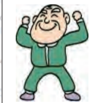
お元気なシルバーの皆さん、まだまだですぞ!