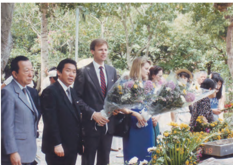
沖繩訪問中にひめゆりの塔を訪れて花束を供えるライアン氏ご夫妻

70年代初頭のウォーターゲート事件の追及、さらに13年のNSA(国家安全保障局)の極秘情報収集活動「PRISM」の告発報道ではピューリッツァー賞の公益部門金賞を受賞している。