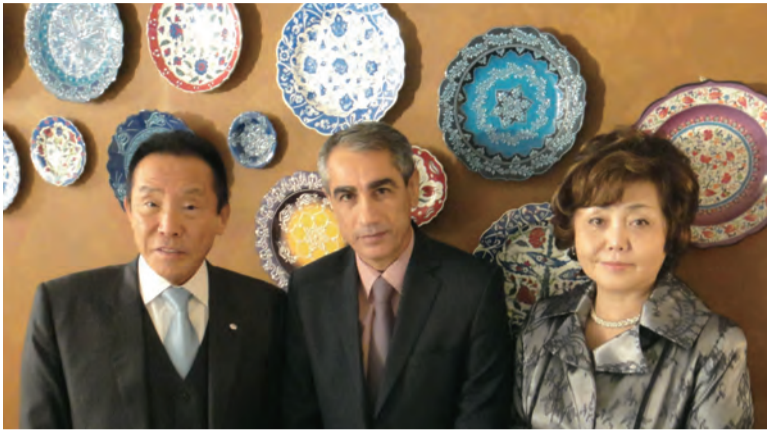
エスカンダー館長(中央)と共に

エスカンダー館長は、03年のイラク戦争と、イラム過激派による地域紛争により、壊滅的な打撃を受けたイラク国立図書館・文書館を守り抜いたことで知られている。 イラクは、チグリス・ユーフラテス川流域に繁栄した世界最古のメソポタミア文明発祥の地であり、数千年に及ぶ歴史的文化遺産と貴重な文化財を有する国である。イラク国立図書館には古代からの貴重な文化財や資料が保存されていた。 その昔、古書は同じ重さの金と交換されていた。同図書館・文書館には、アッバース朝時代のコーランなどが保管されて