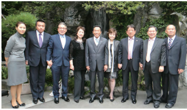
韓国の企業家の方たちと一緒に

エスカンダー館長は、03年のイラク戦争と、イラム過激派による地域紛争により、壊滅的な打撃を受けたイラク国立図書館・文書館を守り抜いたことで知られている。 イラクは、チグリス・ユーフラテス川流域に繁栄した世界最古のメソポタミア文明発祥の地であり、数千年に及ぶ歴史的文化遺産と貴重な文化財を有する国である。イラク国立図書館には古代からの貴重な文化財や資料が保存されていた。 その昔、古書は同じ重さの金と交換されていた。同図書館・文書館には、アッバース朝時代のコーランなどが保管されて