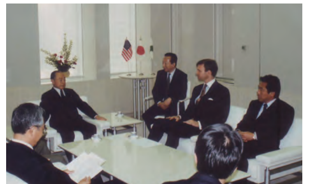
都庁に鈴木都知事(当時)を訪問