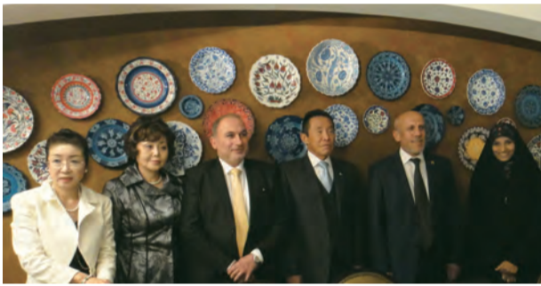
イラクからの訪韓団一行と共に

韓国の企業経営者および政府関係者と会談。また、訪問中のイラク国立図書館・文書館エスカンダー館長とも会談