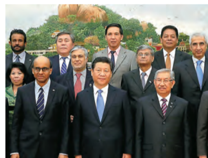
AIIB設立覚書署名式に参加した各国代表

中国主導による アジアインフラ投資銀行(AIIB)発足 日本、懐疑姿勢崩さず 10月、中国は、東南アジアなどの高い資金需要を見込んでアジアインフラ投資銀行(AIIB)の設立を発表した。同月24日には、北京でAIIB設立覚書署名式を開き、アジアの21ヶ国が「設立覚書」に署名した。