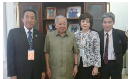
カンボジア首相顧問N・チョルム氏(左から2人目)と共に