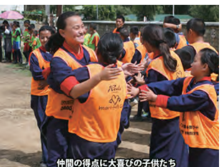
仲間の得点に大喜びの子供たち

徳田様のご紹介で大変貴重な機会を得る事ができました浦和レッズの弊社への訪問は大・大・大成功でした。運動があまり得意ではない子供達とサッカーが大好きな子供達が半分半分だったのですが、落合コーチの熱意あるお話から始まり、皆で「がんばろう!」の掛け声でグラウンドに出てプログラムは始まり、そして浦和レッズの監督方の熱意にドンドン子供達が引き込まれ、最後はもの凄い声援が飛ぶ中皆で声を出し合い、とても楽しくプログラムを終了する事ができました。(浦和レッズハートフルクラブからのお手紙)