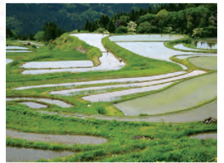
兵庫県養父市の棚田

5千万円以下の遺産相続争いが増加 司法統計によると、14年1月、9月に解決した相続争いのうち遺産額が5千万円以下のケースが全体の約8割を占め、件数はほぼ横ばいの遺産5千万円超とは対照的だ。司法統計によると、今年1月から9月に調停が成立するなどの遺産分割事件は約6千200件あり、遺産5千万円以下の事例は4千700件、1千万円以下の事例は約2千件あった。