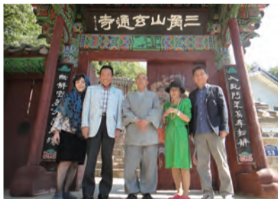
韓国「三角山元通寺」訪問