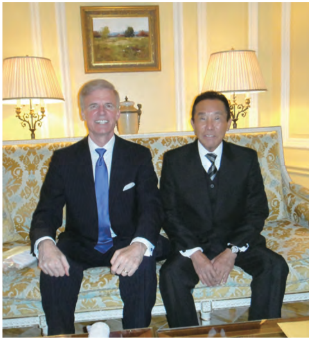
2014年ホワイトハウス訪問時にライアン氏と共に

91年にはレーガン大統領の名代として、日本経営者同友会の招きにより夫人と共に沖繩を訪問。ライアン氏と下地会長は沖繩の各地で当時の沖繩を代表する政財界要人と交歓した。宮古島を訪問した際にライアン氏は「下地会長がレーガン大統領にお話しなされた生まれ故郷、宮古島の美しさを大変うれし」と語った。ライアン氏は沖繩の後、東京を訪問、鈴木都知事(当時)を表敬訪問し、レーガン大統領からの親書を手渡した。