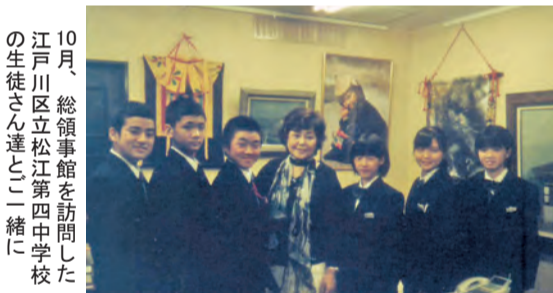
10月、総領事館を訪問した江戸川区立松江第四中学校の生徒さん達と一緒に